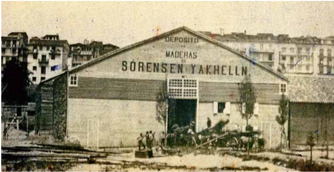
Santander: Sørensen og Jakkhellns lager ca. 1870.