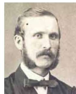
Gründer nummer to: Julius Jakhelln 1868.