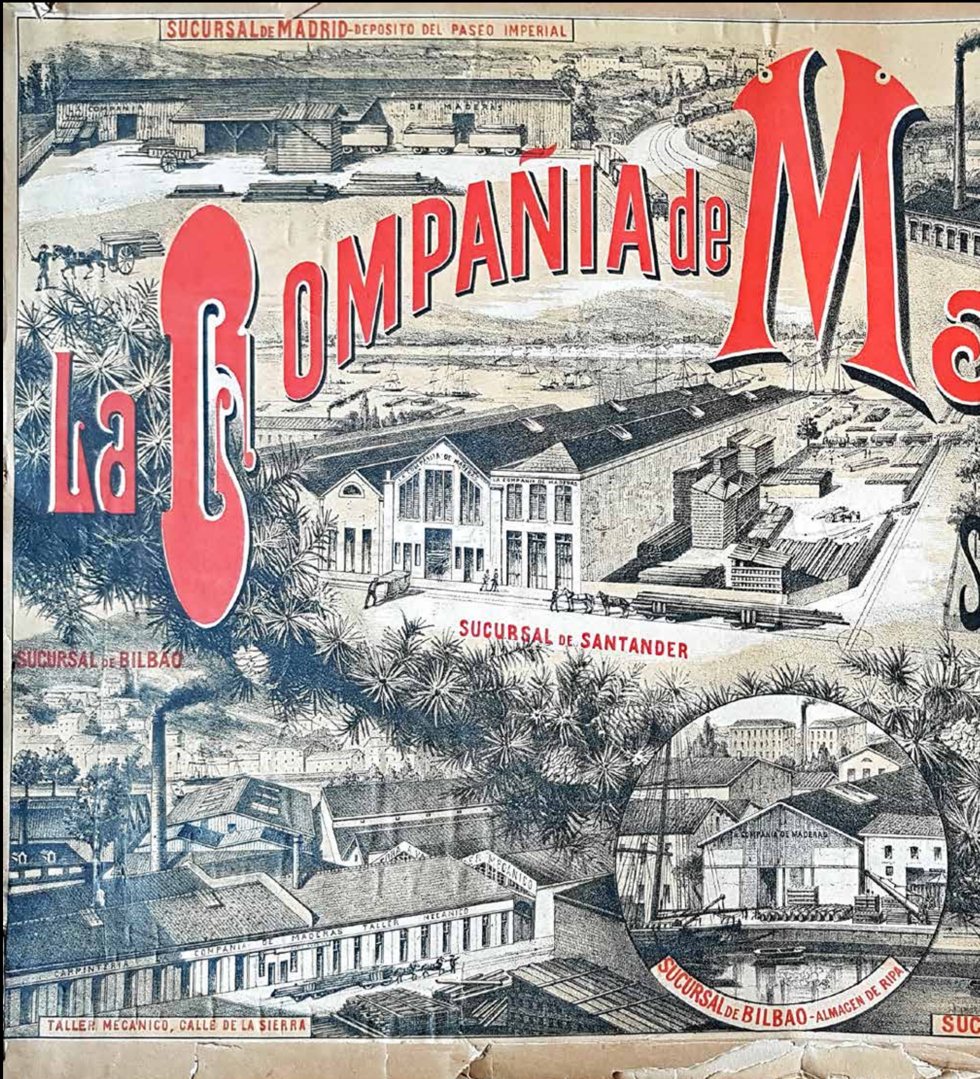
La Compañía de Maderas: Trelastkompaniet ble grunnlagt i 1857, og bygd opp av fire norske gründere. Tegning av kompaniets fabrikker og lagre i flere spanske byer.