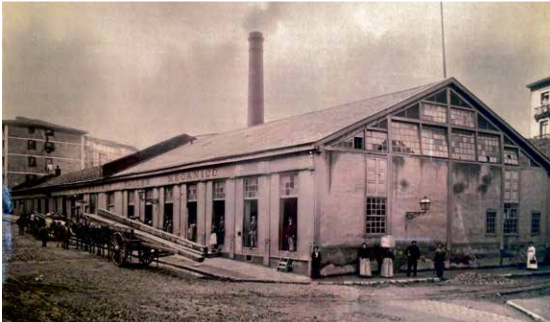
Bilbao: Filialen i Bilbao med verksted og fabrikk i Calle Sierra, ca. 1890.