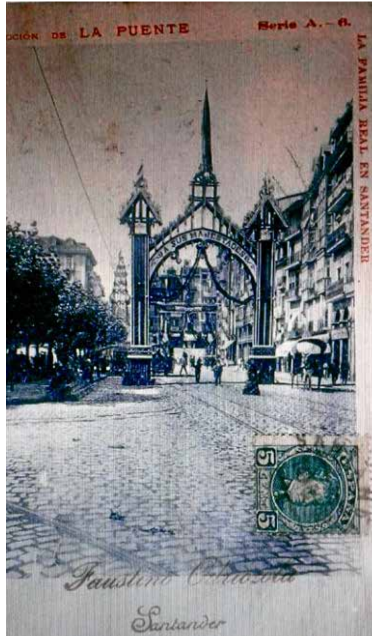
Santander: Triumfbuen ble reist til dronning Maria Cristinas besøk i Santander i år 1900. Produsert ved Trelastkompaniets filial.