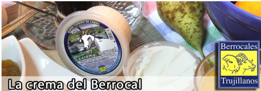
La crema del Berrocal